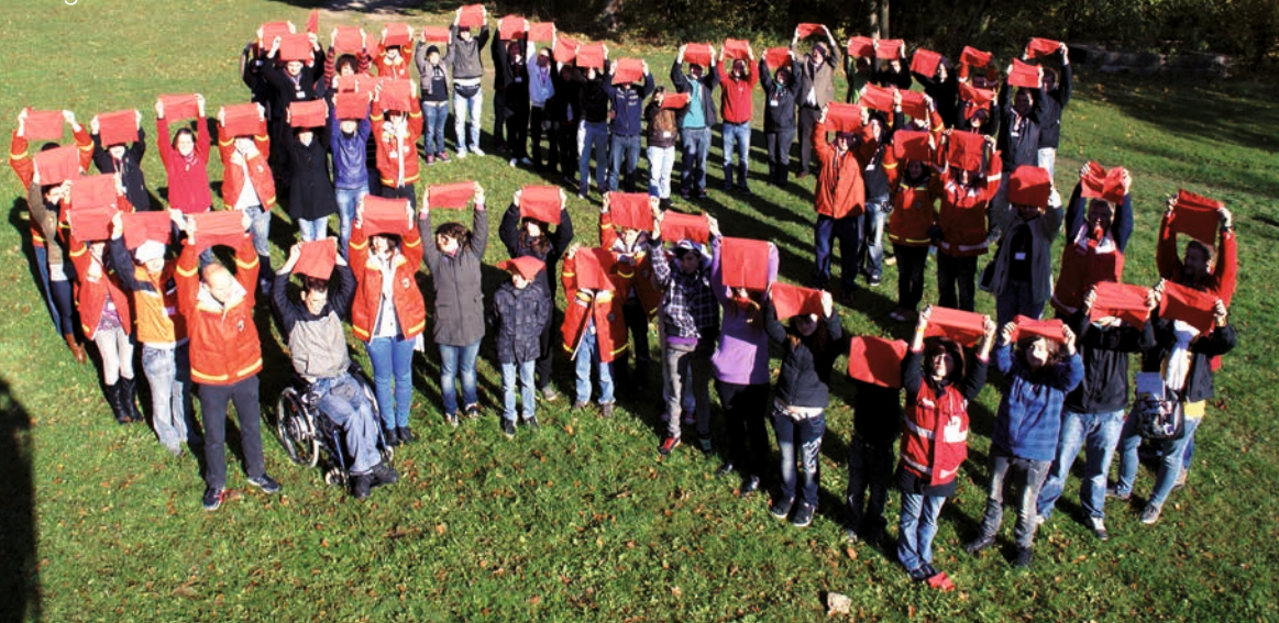
Gruppenbild „Blut+Jung-Camp“ (KIEZ Feuerkuppe, Günthersberge) Oktober 2011