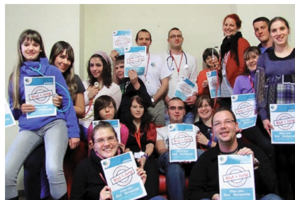
Teilnehmer des Workshops „Alles über Blut+Blutspende“ in Erfurt (November 2011)