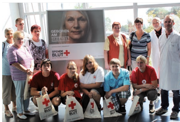
Führung Institut Dessau des JRK Wittenberg und Ortsverein Genthin

Alle Informationen zum JRK-Blutspendeprojekt: www.facebook.com/JRK.Blutspendeprojekt .