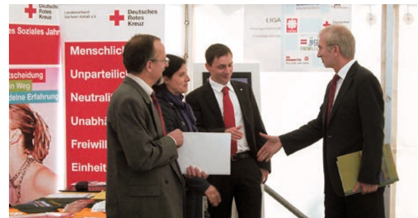
Beim Dialogforum 2011 „Freiwillig. Etwas bewegen“ informierte sich der Minister für Gesundheit und Soziales in Sachsen-Anhalt, Norbert Bischoff, am Stand der DRK-Freiwilligendienste