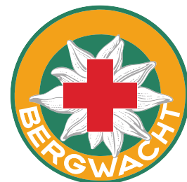
Die Bergwacht Harz im DRK Landesverband Sachsen-Anhalt e.V. besteht aus fünf Bereitschaften: Bergwacht Thale, Halberstadt, Wernigerode, Hasselfelde und Hüttenrode