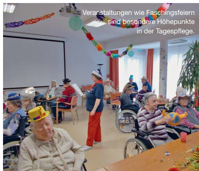
Veranstaltungen wie Faschingsfeiern sind besondere Höhepunkte in der Tagespflege.