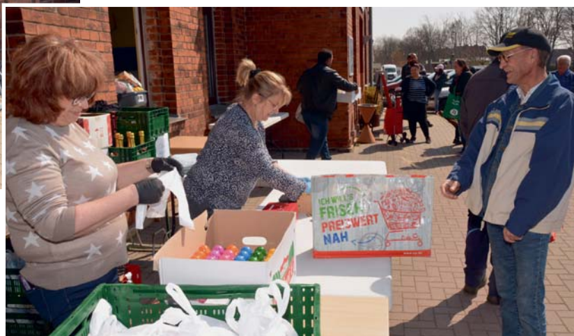
Überbrückung der Ausgabe der Lebensmittelpakete an Bedürftige im Sozialen Zentrum „Alter Bahnhof“ im Freien.